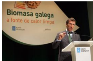
O presidente da Xunta presentou esta mañá ante o sector a Estratexia de Impulso á Biomasa 2014-2020

Santiago, 21 de xullo de 2014.- O presidente da Xunta, Alberto Núñez Feijóo, salientou hoxe que a Estratexia de Impulso á Biomasa 2014-2020 prevé unha mobilización de 450 millóns de euros en investimentos ata o ano 2020, axudas directas que superan os 89 millóns de euros e a xeración de 1.000 postos de traballo. Durante o acto de presentación desta iniciativa ante o sector e os axentes implicados, o mandatario galego explicou que este proxecto nace co obxectivo de "potenciar unha nova industria ao servizo da recuperación económica" da nosa Comunidade, creando "unha auténtica industria da biomasa en Galicia", unha actividade empresarial "punteira" que nos permita ser "líderes e referentes" nesta materia a nivel estatal.